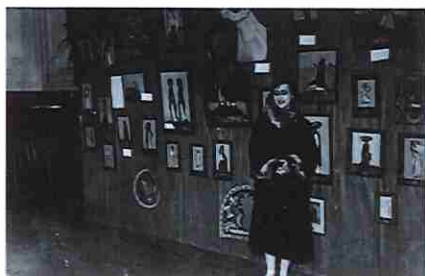
Laura Rodig y la serie Tipos Mexicanos

La composición de los personajes —a modo de boceto—, su lenguaje pictórico con pinceladas rápidas y gruesas, la paleta cromática en la que abundan los amarillos y verdes, la materialidad y estructura de la obra que exacerba la expresión del conjunto de personajes en el mercado, condice con la producción sostenida de Laura Rodig durante su permanencia en México y con los estilos abordados por la autora a partir de entonces, factibles de comprobar con las obras presentes en otras colecciones públicas.