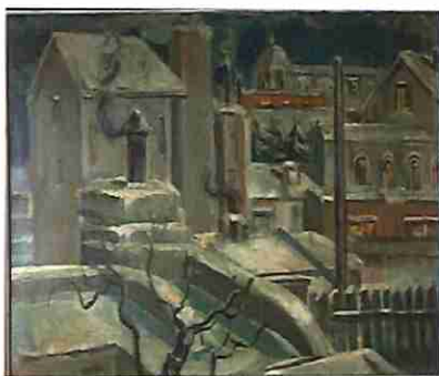
LAURA RODIG Paisaje nevado Ca. 1928 Óleo sobre tela 88 x 103 cm Enmarcado Estado de conservación: BUENO

Propietario: Margarita Vera Valor: $2.000.000.-