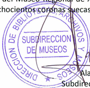
Alan Trampe Torrejón Subdirector Nacional de Museos