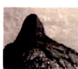
Mount Selkirk, Alejandro Selkirk, Juan Fernandez Island, Chile, Old Print 1885