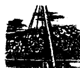
CHILE: H. M. S. Dido, In Pioneer Cove, Spaniard Harbor, Tierra Del Fuego, 1852 E16.99