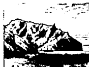
CHILE: Challenger, Cumberland Bay, Juan Fernandez, Antique Print, 1876