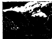
CHILE: Challenger, Desolation Island, Maagellan Strait, Antique Print, 1876