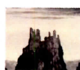
Peterborough Cathedral, Rock, San Felix, Desventuradas Islands, Chile, 1885