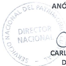
CARLOS MAILLET-ARÁNGUIZ DIRECTOR NACIONAL

SERVICIO NACIONAL DEL PATRIMONIO CULTURAL